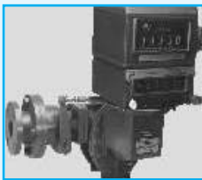
C35 Meter with Preset Valve for Batch Operation