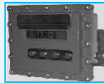
MICROCOMPT Batch Controller