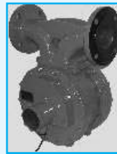
Flowmeter with Pulse Transmitter